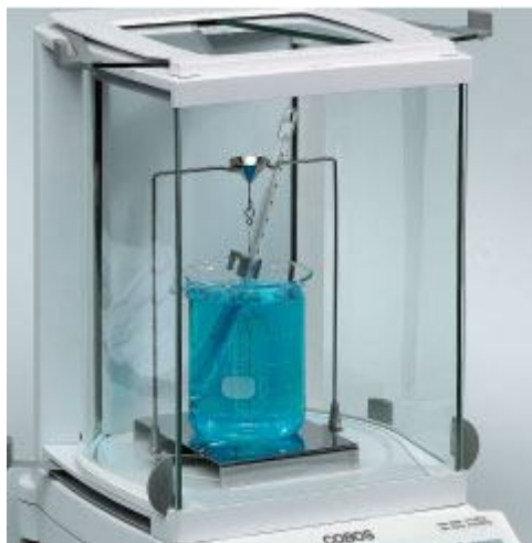
Kit de densidades

Kit para la determinación de la densidad: Materias porosas y líquidas. Introducción de la temperatura del agua para la determinación de la densidad (foto en la balanza analítica)