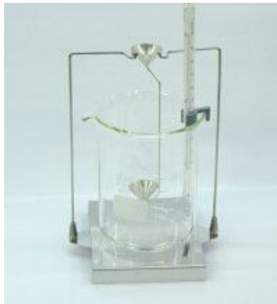
Kit de densidades