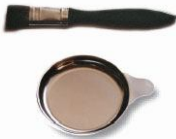
Pincel y platillo