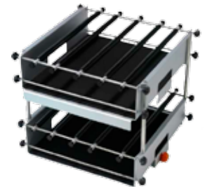
Plataforma universal doble